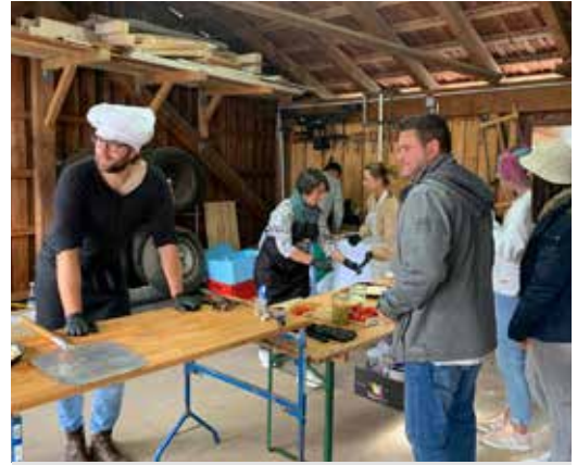
Unser Foto zeigt die Pizzabäcker bei der Arbeit.