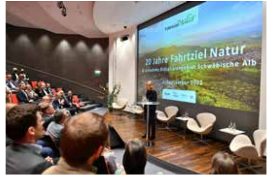
Gratulation und Grußworte zum 20-jährigen Bestehen der Kooperation Fahrtziel Natur gab es auch von der Bundesministerin für Umwelt, Naturschutz, nukleare Sicherheit und Verbraucherschutz, Steffi Lemke.

Der Nationalpark Eifel ist seit 2005 Mitglied in der bundesweiten Kooperation und setzt sich gemeinsam mit seinen Partnern für eine attraktivere Mobilität vor Ort ein. Erste Meilensteine waren die Einführung eines ganzjährig verkehrenden Nationalpark-Shuttles (SB 81) zwischen dem Bahnhof Kall und Vogelsang. Der Internationale Platz Vogelsang mitten im Nationalpark Eifel ist nicht nur ein hervorragender Ausgangspunkt, um das Schutzgebiet zu erkunden, sondern hier befindet sich auch das Nationalpark-Zentrum Eifel mit seiner großen Erlebnisausstellung „Wildnis(t)räume“.