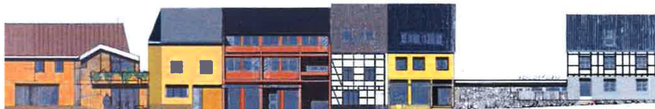
Gasthof Eifeler Hof